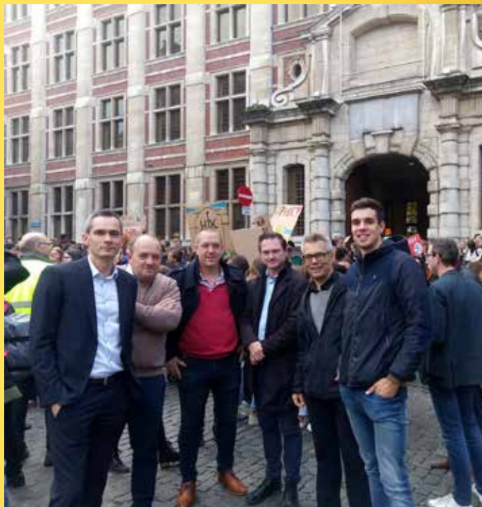
▲ N-VA Leuven steunt de leerlingen, ouders en leerkrachten die zich tegen de fusie verzetten. Niemand wordt beter van eenheidsworst.